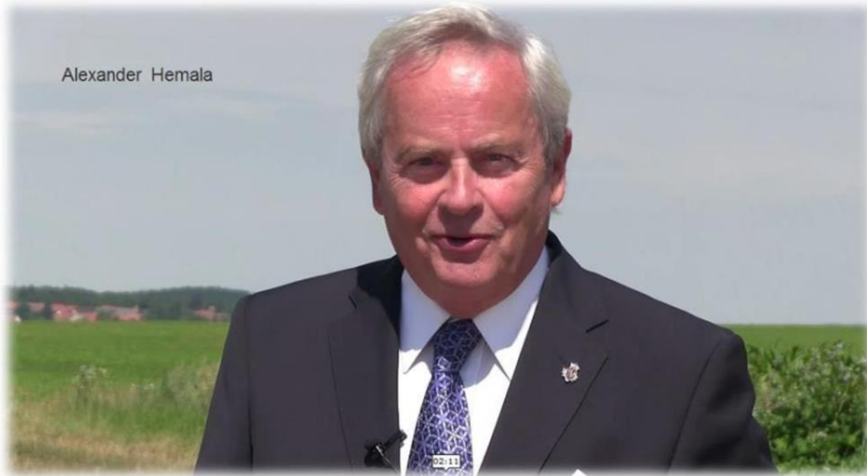
Kommentar des legendären tschechischen Moderators und TV-Ansagers (Auftritte von 1973-2005)

Das Lied vom Wasser wird ganz im Sinne der Vortragskünstler interpretiert und die Musikrichtung wird bewusst und untypisch für die Bläsergruppe Markazini (Frischlinge) gewählt und soll noch mehr die Absurdität unseres Wirkens gegen die Natur unterstreichen. Auch deshalb haben die Künstler vielleicht den aufrüttelnden Untertitel dieses Stückes ausgewählt „versöhnen wir uns mit unserer Natur, wir haben keinen Anspruch auf eine andere“